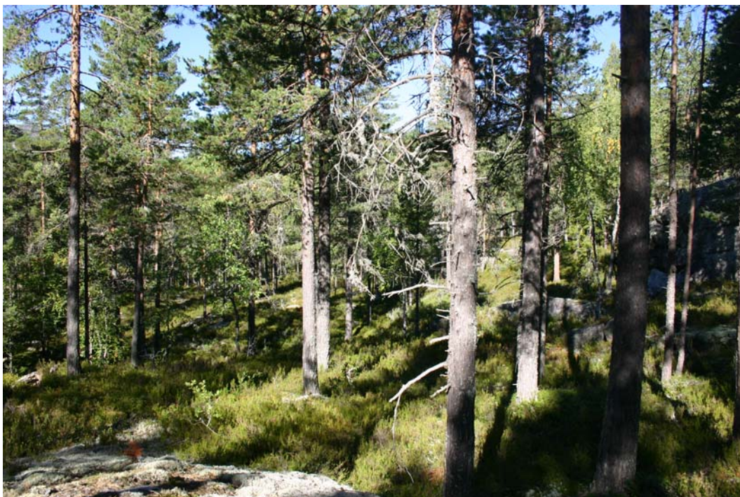
Røsslyngskog frå nordre del av området.

Der finst ikkje vegetasjonstyper som utmerkar seg med høg verdi for biologisk mangfald.