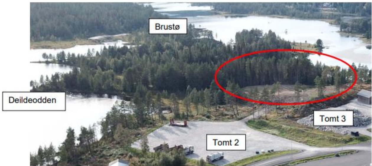
Sletteemoen med tomt 2 til venstre og tomt 3 til høgre