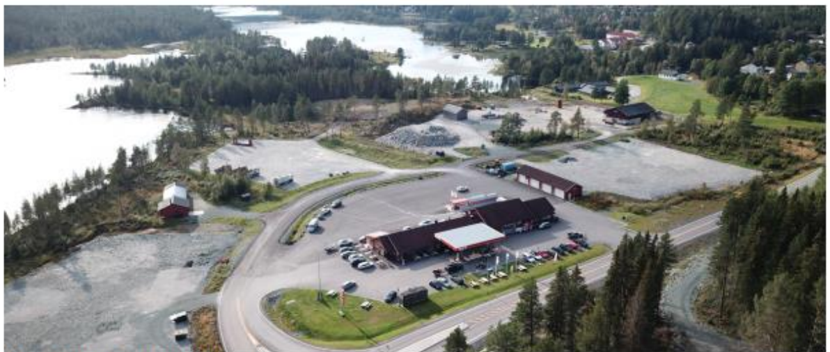
Oversiktsbilete Høydalsmo Aust