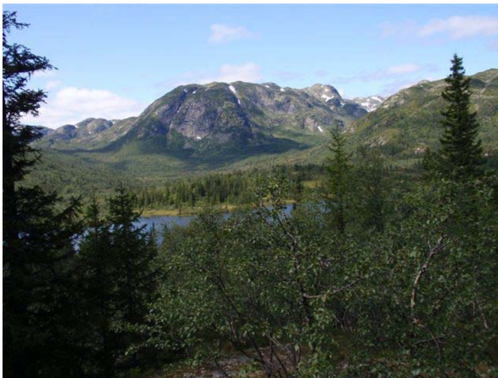
Figur 1 Botnedalsvatnet med Hovund i bakgrunnen

I sør går eigedomen frå Botnedalsvatnet. I vest grensar den mot eigedomen Hovund, gnr 105, bnr 7 og i aust grensar den mot eigedomen Vebrandsdalen, gnr 89, bnr 1 der det er 4 hytteeiningar inkl stølen. I nord går den over Lofthusnuten til bekkeskilje mellom Flovatn og Flottjønn. For Hovundeigedomen, 105/7, er det ein reguleringsplan for hytter som blei godkjent i 2006.