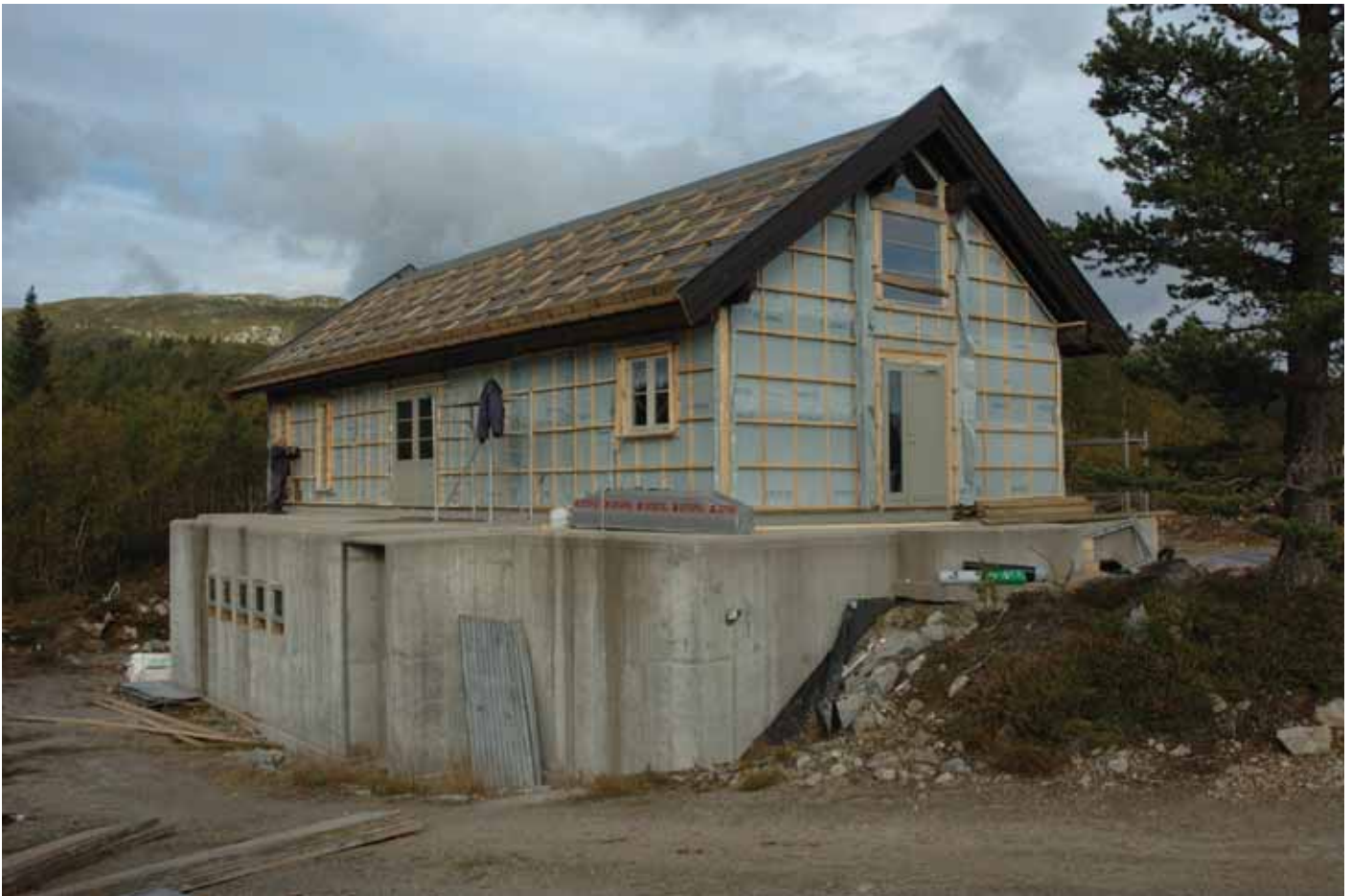
Fjellkyrkja 18.september 2008. Vi ser at taket har kome på, det står att å kle utvendig, og isolere og kle innvendig.