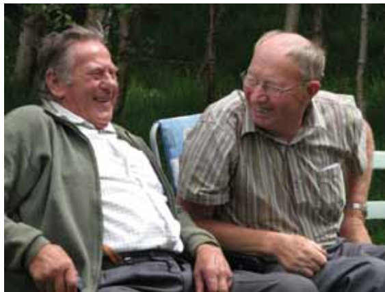
Folk kosa seg med mat og gode røur