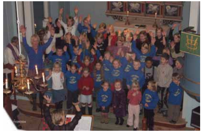
Tokke barnekor - «Tusen stjerner»

Konsertprogrammet var omfattande, det var fleire innslag av Tokke songlag og Tokke barnekor - «Tusen stjerner». Det var og fleire av elevane i Tokke kulturskule som hadde soloinnslag. Alle var flinke og gjorde kvelden til ei oppleving ein vil hugse ei stund.