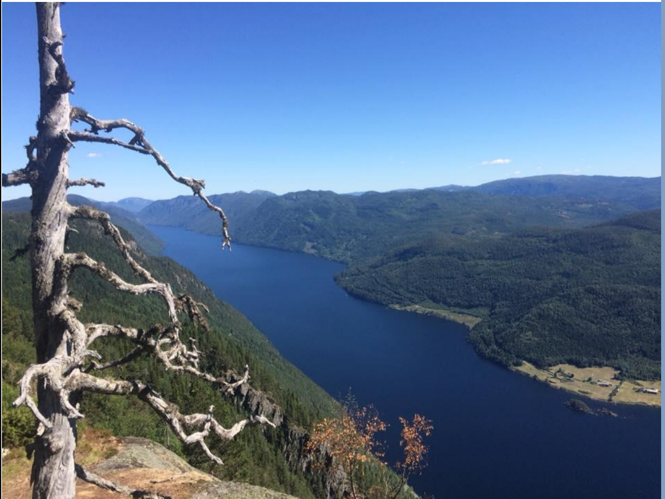
Frå Lårdalsstigen, mot Lauvik og Bandakslid.