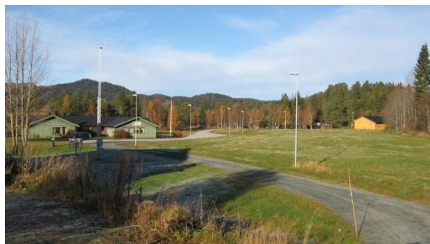
Bilete 7: Alderspensionat