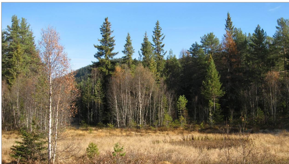
Bilde 6: Typisk vegetasjon i område

Planområdet går inn under landskapsregionen Dal og fjellbygder i Telemark og Agder. Dei vestlege delane av området er i all hovudsak myr med enkelte skogkrullar. Det er eit belte med skog mellom dette myrområde og området mot E 134. I dette skogbelte er det ein kolle som gjer eit naturleg skilje mellom dei to områda. Skogen er eldre blandingsskog og marka er, utan kollen, meir eller mindre fuktig over heile området. Felt vegetasjonen består i all hovudsak av gras i dei fuktige områda og innslag av lyng i dei tørrare partia.