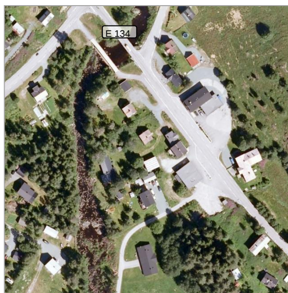
Bilete 9: Avkjørsel i nord (Norge i bilder)