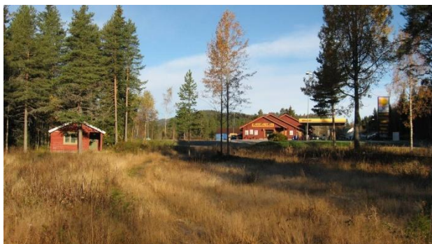
Bilete 6: Bensinstasjon sett frå sør

Området inneheld i dag ein bensinstasjon med vegkro og veg bibliotek og andre fasilitetar for langtransport sjåførar. I tilknytning til bensinstasjonen ligg og lokala til gravferdsbyrå og lokala til pinsemenigheten. Alderspensionat ligg ved utløpet til Ofteåi nord i området. Det ligg eit gardstun (Søndre Ofte) nord aust i området. Mesta har ein lager bygning på dagens industriområde. Lengst sør i område ligg reinseanlegg og to små hytter.