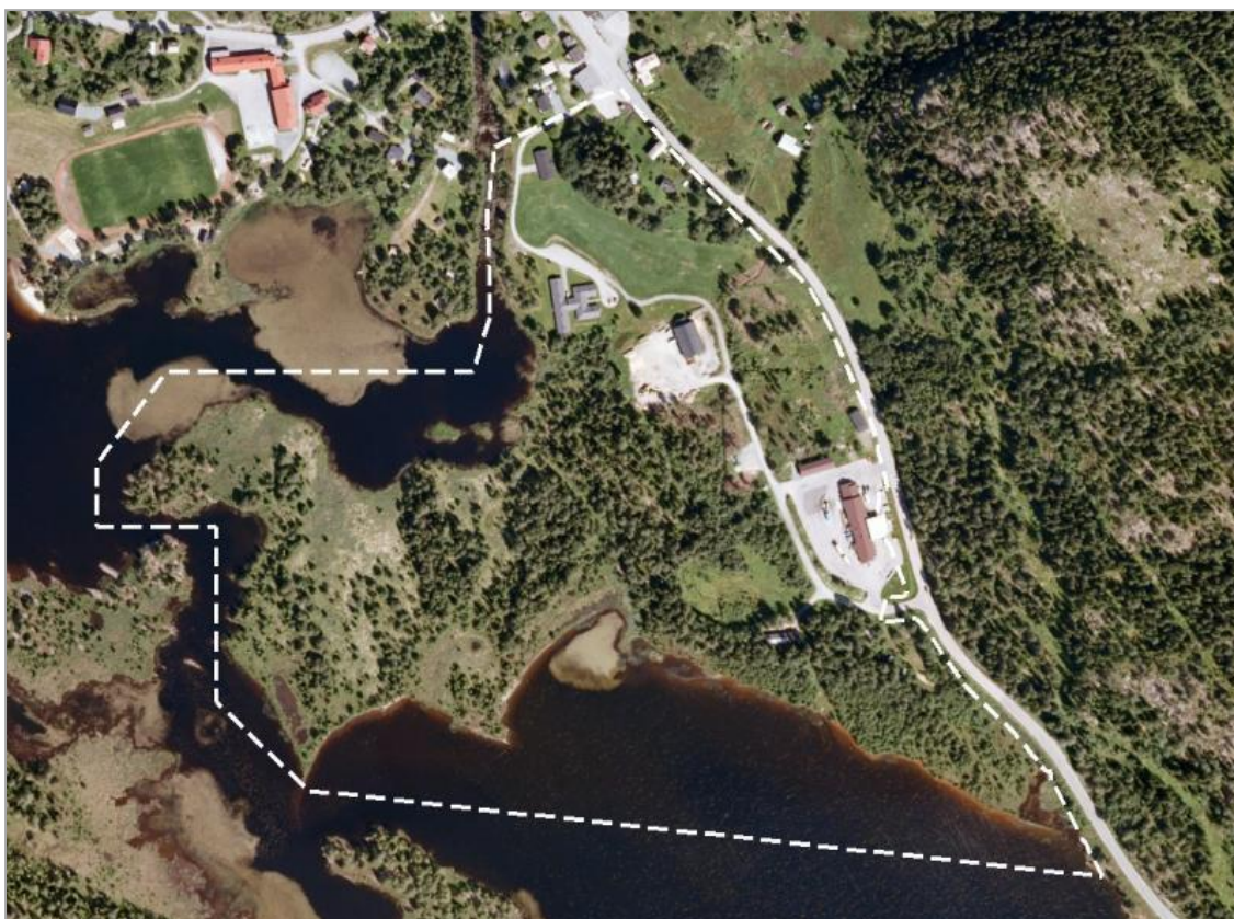
Bilete 3: Flyfoto over området