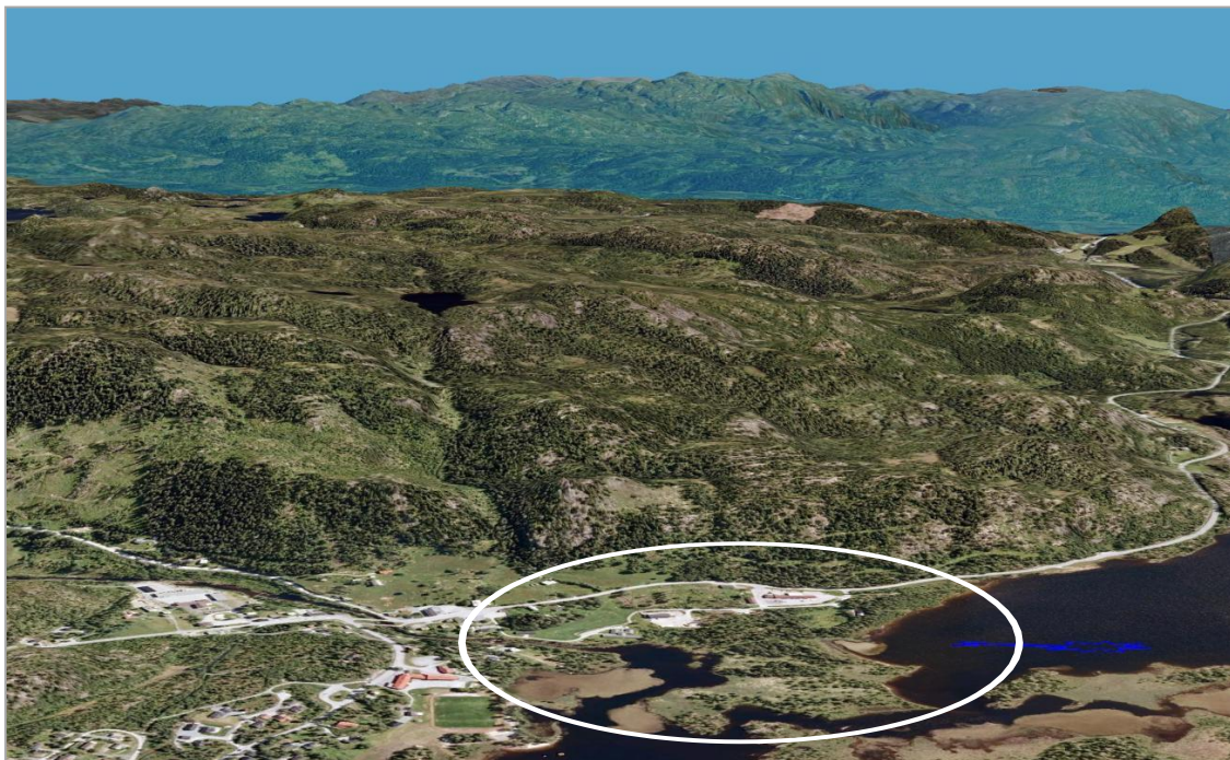
Bilete 4: Høydalsmo sett frå vest (Virtual globe)

I tillegg til føresegner og retningslinjer i kommuneplanen sin arealdel, har Tokke kommune utarbeidd egne krav til private reguleringsframlegg. Desse er søkt ivareteke der dei er vurdert relevante for planarbeidet, samt lagt til grunn ved utforming av reguleringsføresegnene.