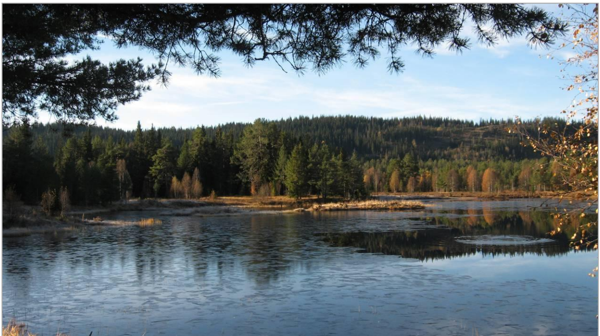
Bilete 10: Oftevatn (nordre) sett frå alderspensjonatet

Området ligg ved Oftevatn og Ofteåi renn ut i vatnet nord i planområde. Deildeodden/Slettemoen står delvis under vatn ved høge vassføring delar av året. Flomsituasjon er nærmere omtala i vedlagt KU.