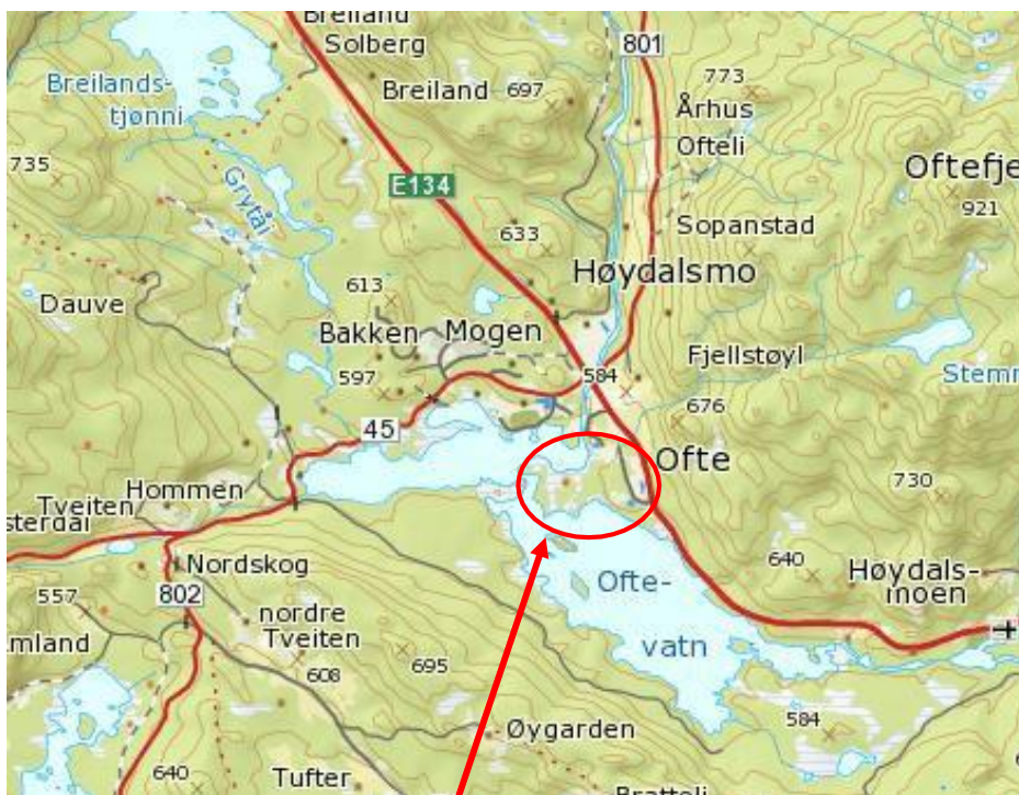
Bilete 1: Oversiktskart, planområdet

Hausten 2022 var det trong for å endre på planen. Ein vil nå ta vekk høve til camping/ utleige/ motell, og i staden legge til rette for bustadbygging.